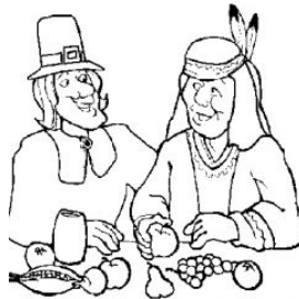
Sauvés par les indiens