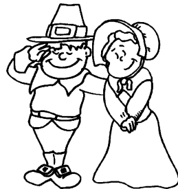
Des « pèlerins »